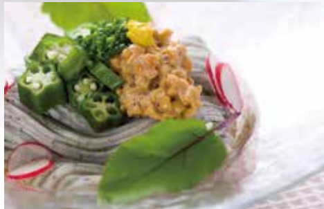
手延べ黒ごま麺 調理例