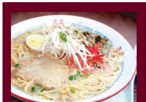
博多ラーメン 調理例