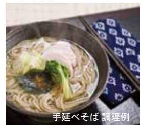
手延べそば 調理例