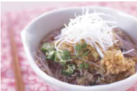
手延べ紫いもめん 調理例