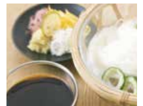
焼きあご麺つゆ調理例